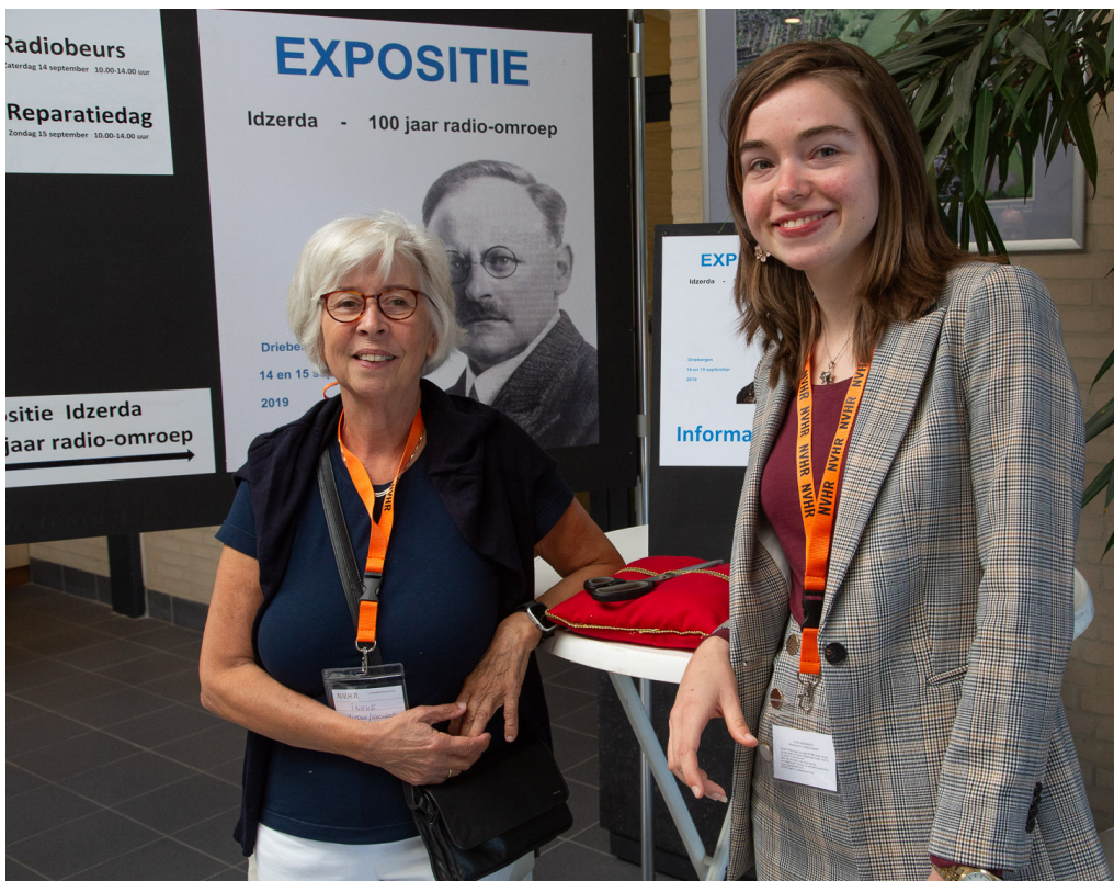
Er waren ook twee gastvrouwen aanwezig.