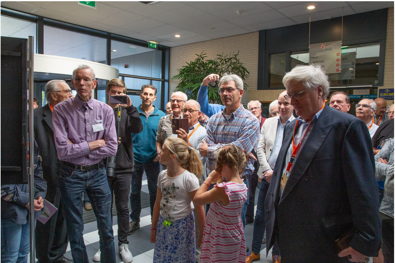
Het wachtende publiek