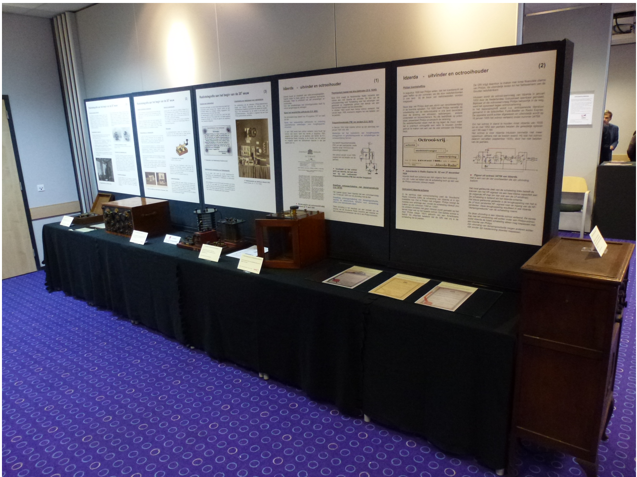
De wand daartegenover is gewijd aan morse met onder meer te toestel Militair, dan de Marine B, dan de Demonstratie vonkenzender van het Verbindingsmuseum en dan een radiatorichtingzoeker. Op de hoek de salonkast Goudse Radio-Industrie met het octrooi vrij Idzerda schema.