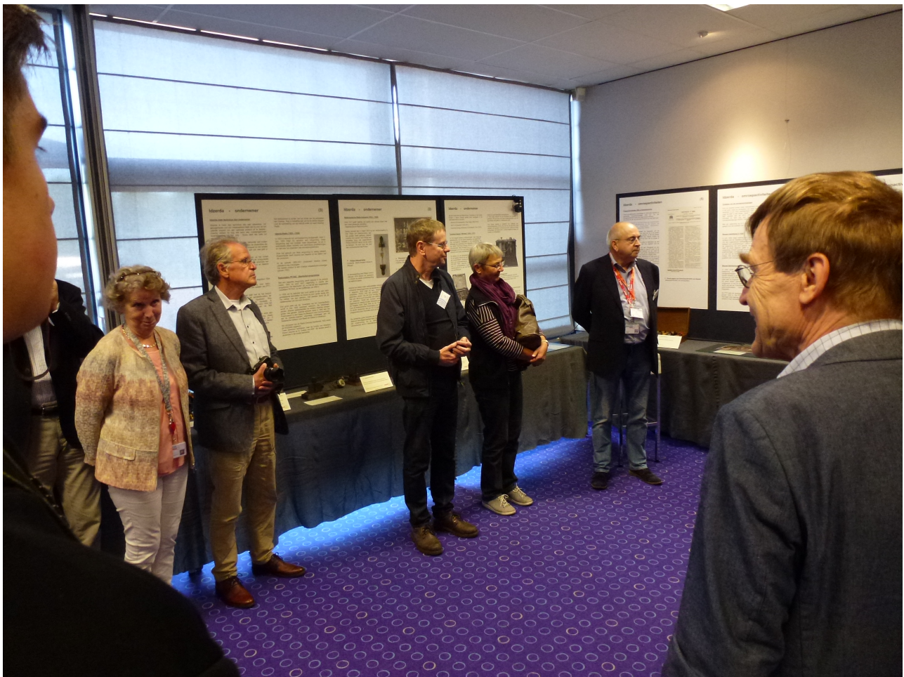
Voor de opening van de tentoonstelling eerst overleg met de “zaalwachters”. En het begin van de bordenrij aan de raamkant.