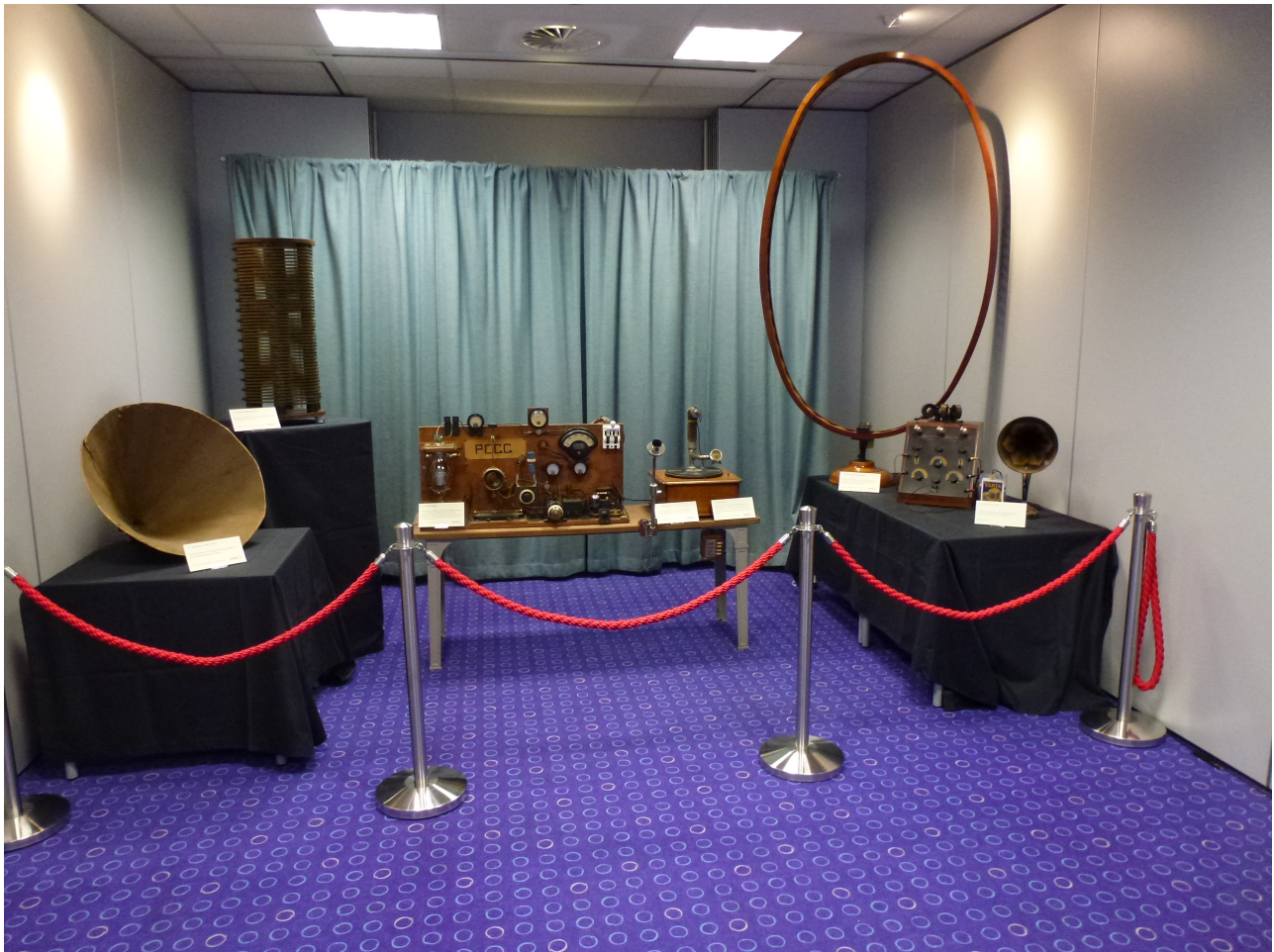
De Idzerda zender in het bezit van Beeld & Geluid, met grammofoon, microfoon, antenne verlengspoel, kartonnen “toeter” en een reusachtige raamantenne